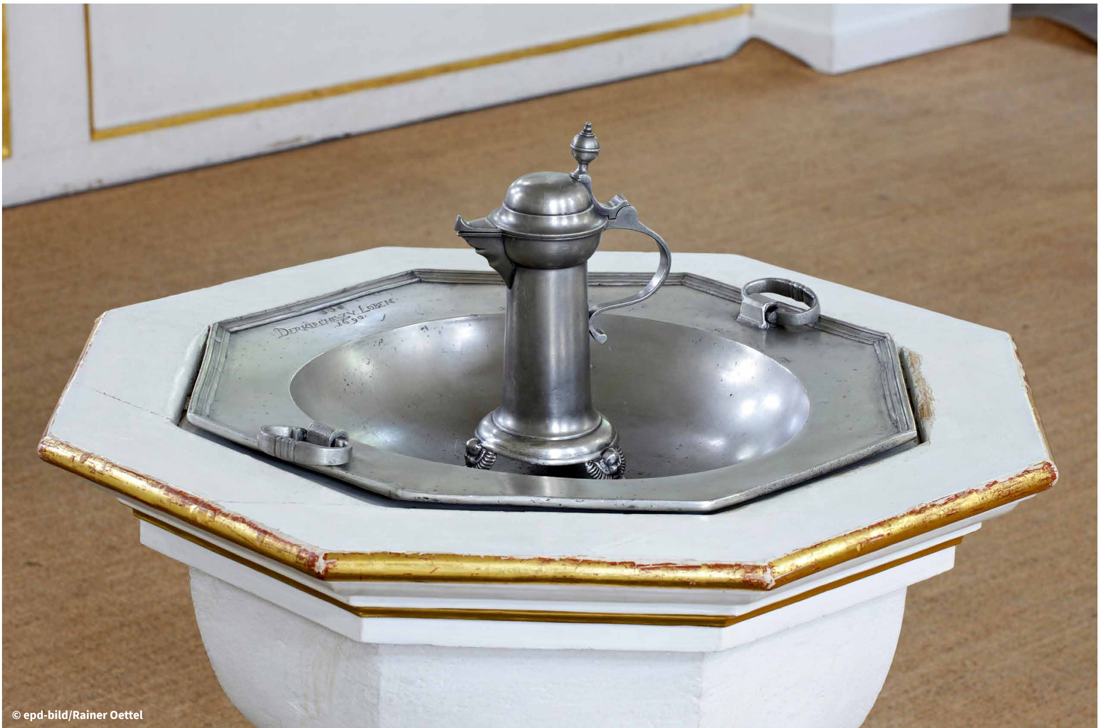
Taufkanne und Taufschale in der evangelischen Dorfkirche Lohmen in Sachsen.