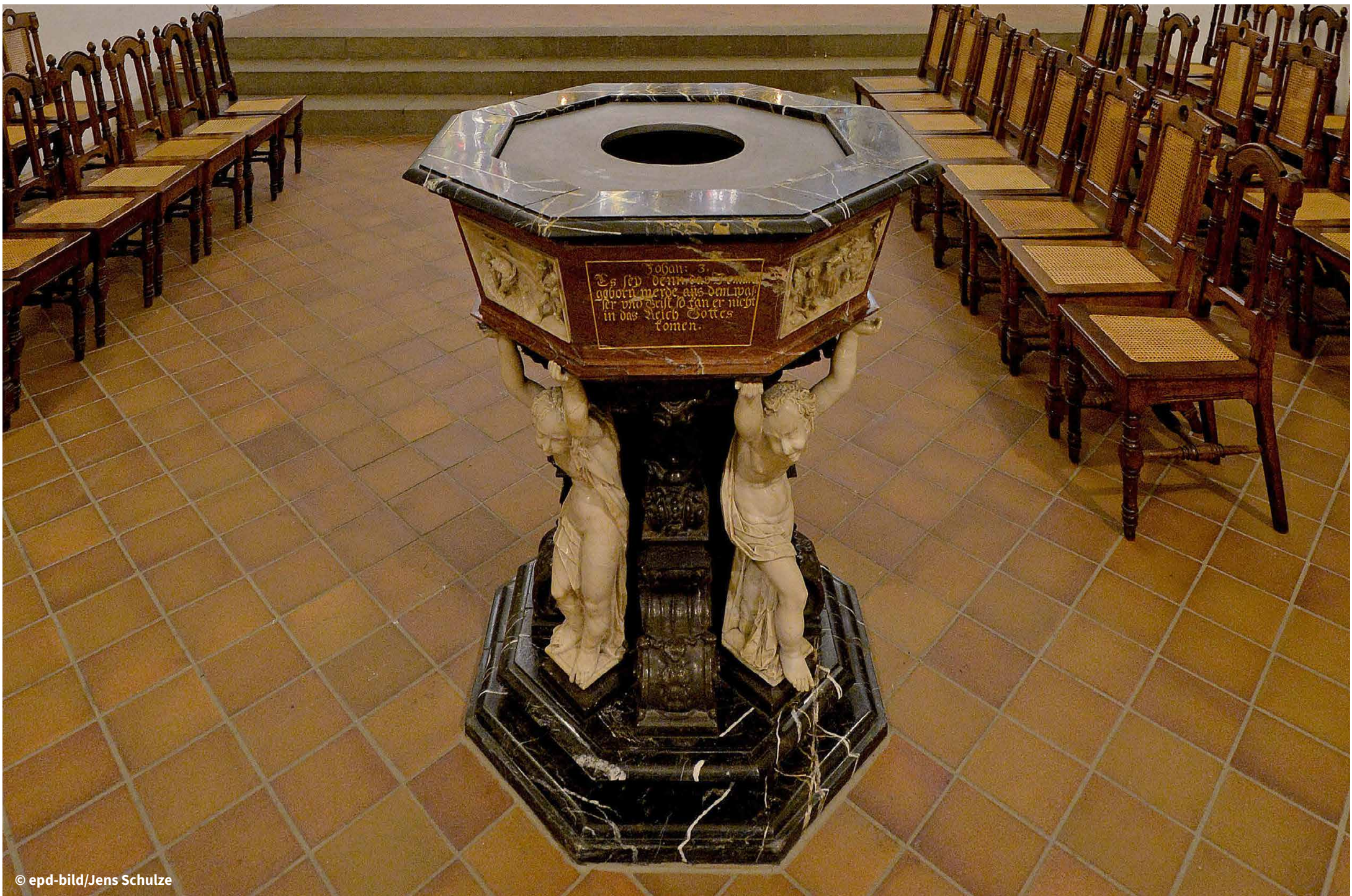
Taufbecken im Altarraum der evangelischen Thomaskirche in Leipzig.